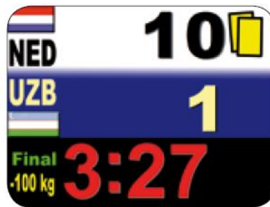
Abb. 2: Elektronische Anzeigetafel

Die Anzeigetafeln müssen die Normen der IJF bzw. dieses Dokuments erfüllen und den Kampfrichtern entsprechend zur Verfügung stehen. Manuelle Stoppuhren müssen, für den Fall des Ausfalles der elektronischen Stoppuhren, parallel zu den elektronischen Geräten verwendet werden. Manuelle Anzeigetafeln müssen in Reserve zur Verfügung stehen.