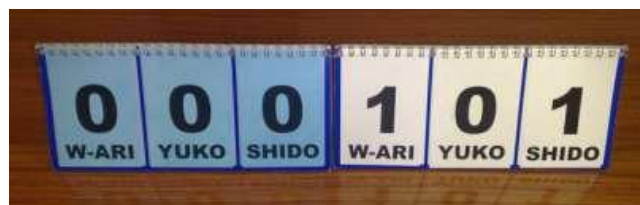
Abb. 3: Manuelle Anzeigetafel

Beispiel: Weiß punktete mit Waza-ari und wurde auch mit zwei (2) Shido bestraft. Blau punktete mit einem (1) Yuko .