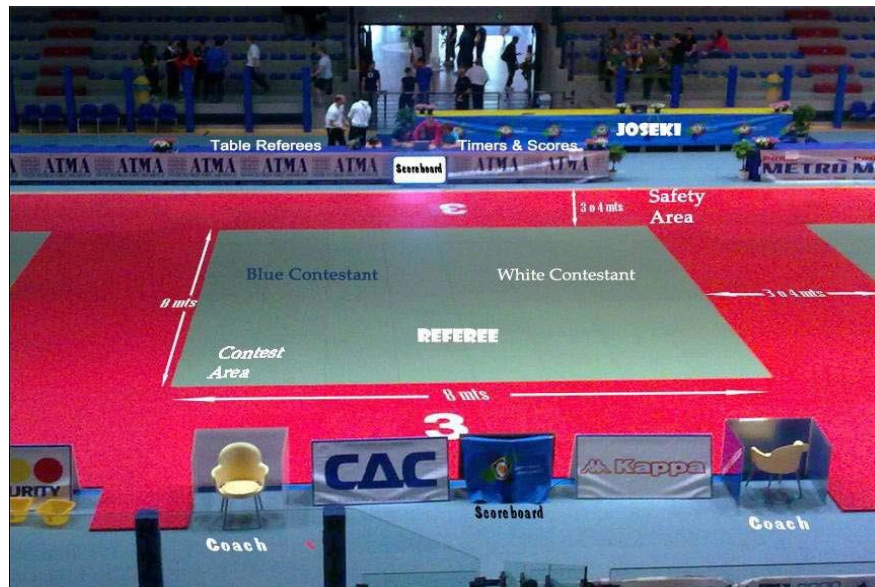
Abb. 1: Positionen der Offiziellen und der Kämpfer (weiß/blau)

Die Matten (Tatami) müssen eine Abmessung von 1 m x 2 m oder 1 m x 1 m haben und aus gepresstem Schaumstoff bestehen (gemäß technischer Spezifikationen der IJF). Die Oberfläche der Elemente, welche die Wettkampffläche bilden, muss eben sein und darf keine Zwischenräume aufweisen und die Elemente müssen so fixiert sein, dass sie sich nicht verschieben können. Verzahnungsmatten dürfen nicht verwendet werden.